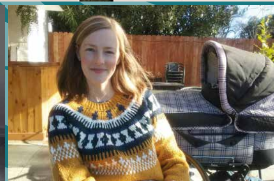
How do we help here at Reden International? Employee day at KFUK's Social Work